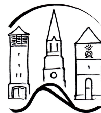
PFARREIENGEMEINSCHAFT DÖRPEN - DERSUM - HEEDÉ

Wir freuen uns sehr auf Ihre Einsendungen und wünschen uns durch den gemeinsamen Namen eine gute Identifikationsmöglichkeit.