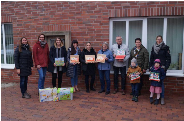
Auf dem Bild v.l.n.r.:

Das ganze Team bedankt sich bei den vielen Helfern, den Kuchenbäckern, den Verkäufern und Käufern und freut sich im nächsten Jahr, voraussichtlich am 02.04.2022, auf ein Wiedersehen.